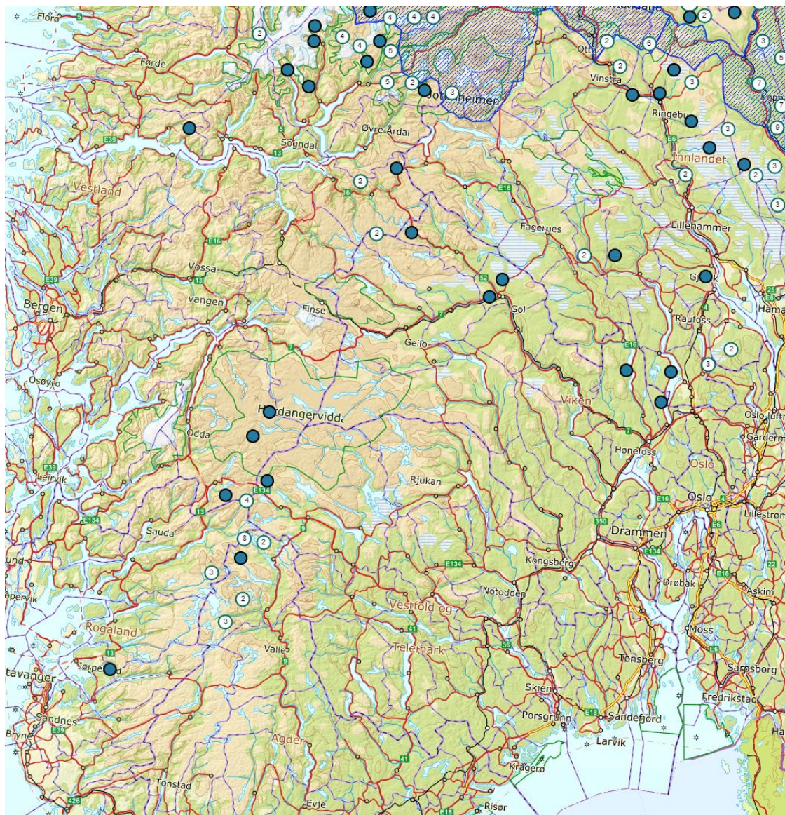
Figur 3. Påviste observasjoner av jerv (vurdert som dokumentert eller antatt jerv av Statens naturoppsyn) i og nær rovviltregion 2 vinteren 2020/2021.

I sist lisensfellingsperiode (10. september 2020 - 15. februar 2021) ble det til sammen felt eller belastet 74 jerver av en samlet kvote på 143. I region 2 var kvoten på to dyr, men ingen ble felt.