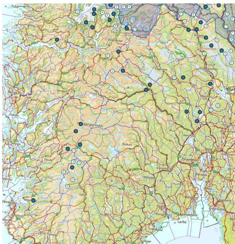
Figur 1. Påviste registreringer av jerv (vurdert som dokumentert eller antatt jerv av Statens naturoppsyn) i og nær region 2 vinteren 2020/2021.

Jerv er påvist i og nær regionen gjennom sist vinter (oktober – april), sist i Agder (Bykle) i mars og april. I januar ble det gjennom DNA påvist ei tispe i Bykle kommune (28.1) og i mars en hannjerv i samme kommune (16.3). Hannjerven var tidligere registrert i Etnedal og på Hadeland i perioden september 2020 - januar 2021.